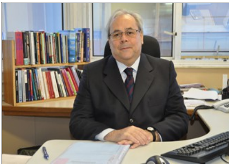
Des. Flavio Portinho Sirangelo

Os 27 anos de atuação na segunda instância da Justiça do Trabalho gaúcha fazem do desembargador Flavio Portinho Sirangelo o decano do Tribunal Regional do Trabalho, 4ª Região (RS). O magistrado, temporariamente afastado da jurisdição para atuar no Conselho Nacional de Justiça (CNJ), ingressou no TRT-RS em 1987, em vaga reservada ao Ministério Público do Trabalho pelo Quinto Constitucional. Foi vice-presidente do Tribunal no biênio 1996/1997, presidente no período 1998/1999 e o primeiro diretor da Escola Judicial (de 2006 a 2010).