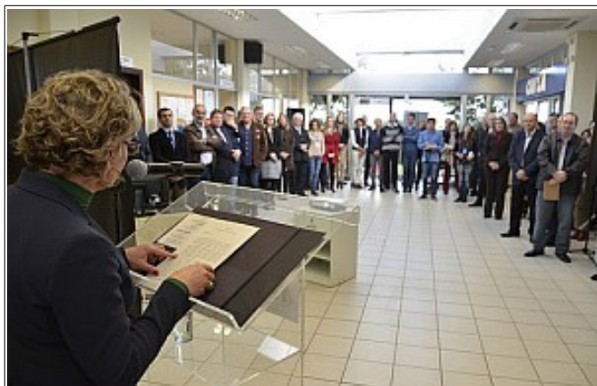
Solenidade em Lajeado

Acesse as imagens das cerimônias de implantação do PJe-JT em Lajeado e Montenegro .