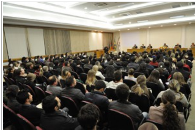
Sessão da 3ª Turma na Universidade de Passo Fundo