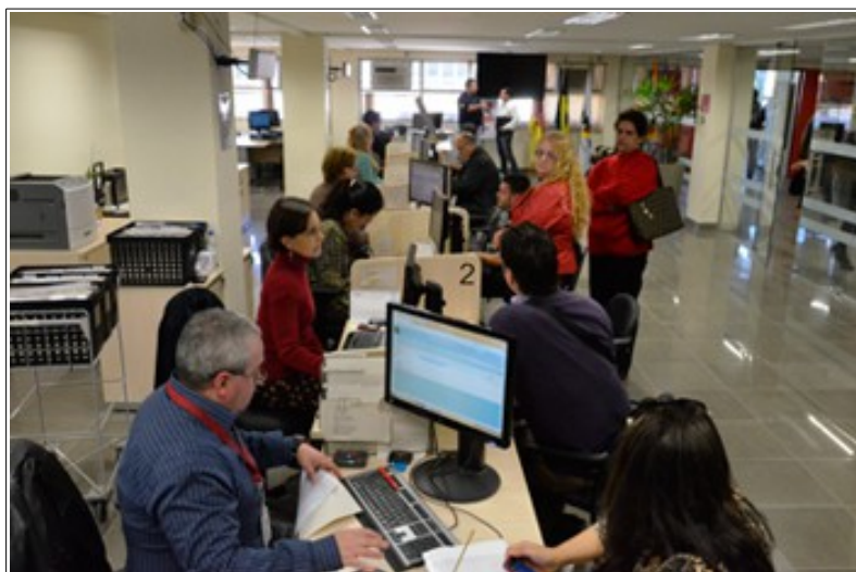
CAP de Porto Alegre norteará expansão para demais cidades

A Justiça do Trabalho de Rio Grande do Sul está qualificando o atendimento prestado por seus servidores aos usuários do Processo Judicial Eletrônico (PJe-JT). Tomando por modelo a Central de Atendimento ao Público (CAP) do Foro Trabalhista de Porto Alegre, servidores das 17 cidades do Interior do Estado onde já está implantado o sistema receberam treinamento para melhor prestar esse auxílio às partes, advogados e demais usuários do processo eletrônico.