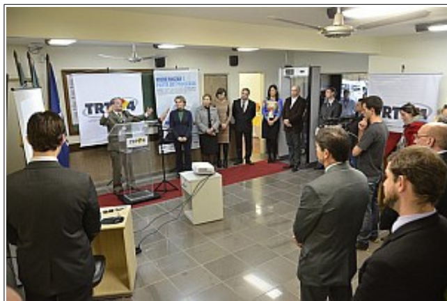
Solenidade em Montenegro