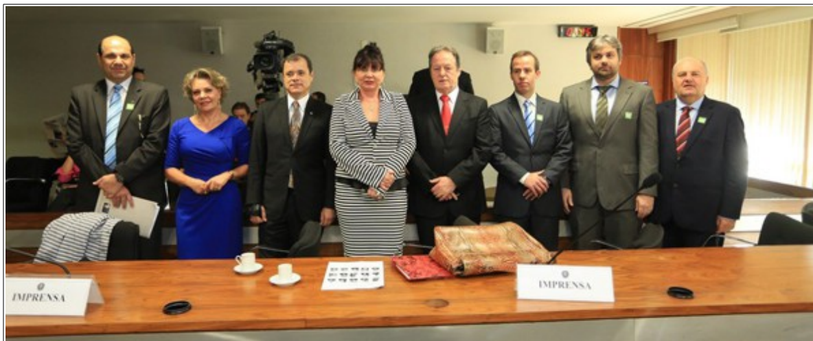
Sabatina foi acompanhada por lideranças e membros da magistratura