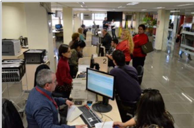
Central de Atendimento ao Público