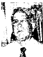
JOSÉ LUCIANO CORREGEDOR-GERAL