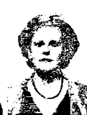
ROSA MARIA WEBER