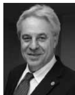
BARROS LEVENHAGEN Corregedor-Geral