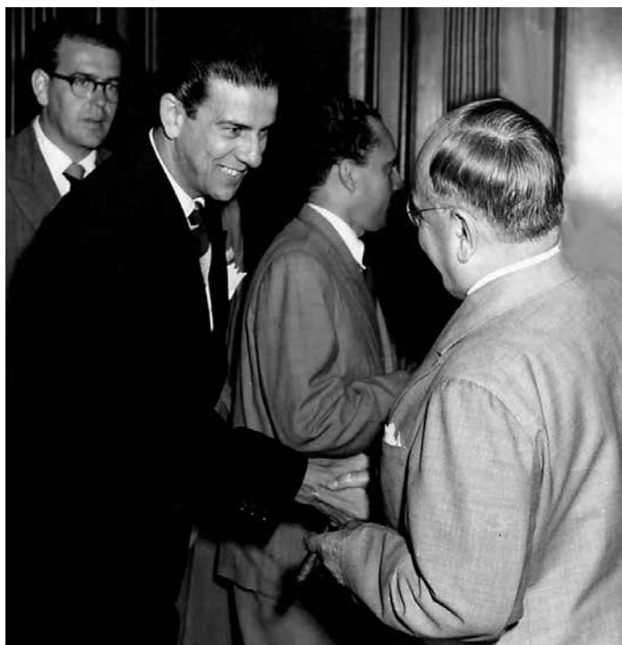
Em cerimônia no Palácio do Catete, o presidente Getúlio Vargas agradece a Süssekind pela dedicação na elaboração da Consolidação das Leis do Trabalho (CLT).