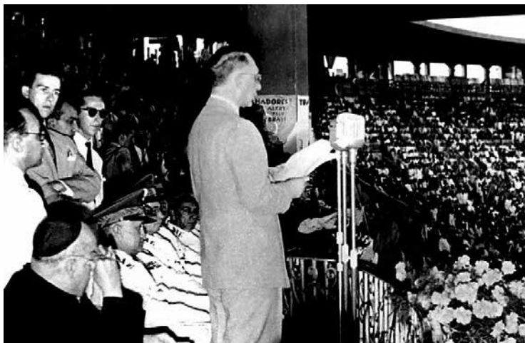
Na comemoração do Dia do Trabalhador, em 1º/5/1942, o ministro do Trabalho e Previdência Social Alexandre Marcondes Filho discursa no estádio de São Januário, no Rio de Janeiro, com a presença de Arnaldo Süssekind.