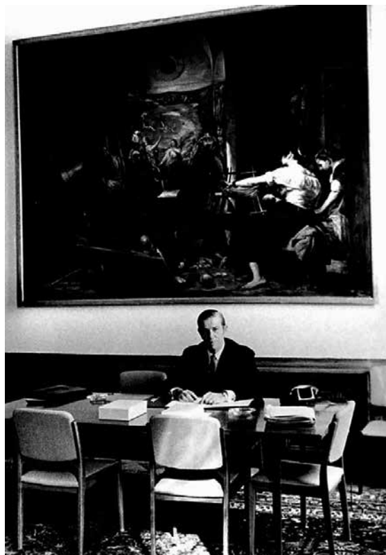
Arnaldo Lopes Sússekind em seu gabinete no Tribunal Superior do Trabalho (TST), 1965.