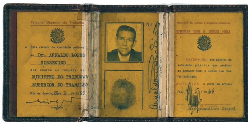
Carteira de Ministro do Tribunal Superior do Trabalho, cuja posse no cargo ocorreu em 3/12/1965. Aposentou-se em 26/8/1971.