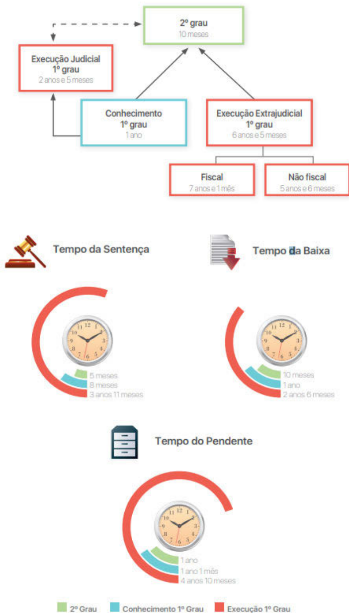
FIGURA 2 - TEMPO MÉDIO DO PROCESSO BAIXADO NA JUSTIÇA DO TRABALHO.