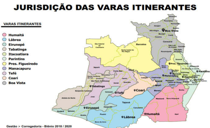
Figura 1: Mapa de Jurisdição das Varas do Trabalho do Amazonas e Roraima

Abaixo, traz-se o mapa da jurisdição ampliada das referidas Varas do Interior dos Estados de Amazonas e Roraima: