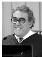
Aloysio Corrêa da Veiga (Corregedor-Geral)