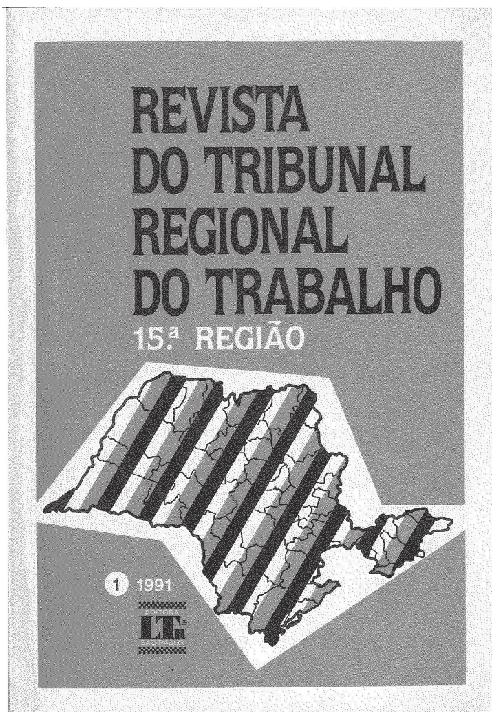
Capa da primeira Revista publicada pelo TRT da 15ª Região em 1991.