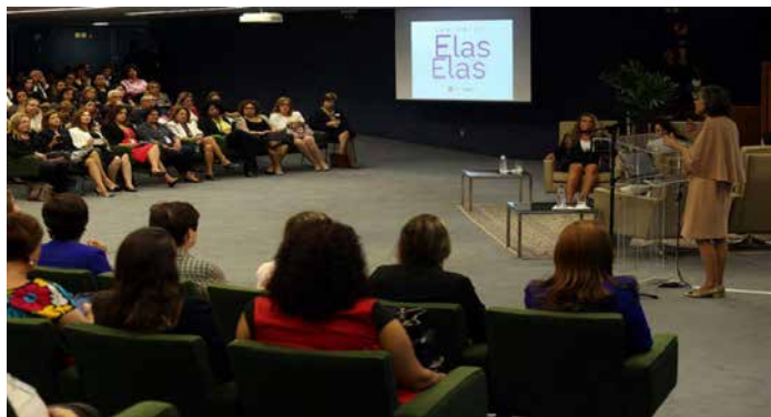
Ministra Cármen Lúcia chamou a atenção para o aumento dos casos de violência contra a mulher, fazendo referência aos casos de feminicídio.

As conquistas da mulher bem como os desafios que enfrenta por reconhecimento e inserção na sociedade estiveram em debate no seminário “Elas por Elas”. O evento organizado pelo Conselho Nacional de Justiça (CNJ) reuniu, na segunda-feira (20/8), no Supremo Tribunal Federal (STF), mulheres que são autoridades do Poder Judiciário, executivas no setor privado e nomes proeminentes do mundo das artes e do entretenimento.