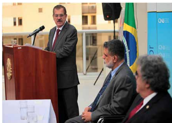
Solenidade de assinatura do Termo de Cooperação Técnica entre a Corregedoria Nacional de Justiça e a Corregedoria-Geral da Justiça do Trabalho.