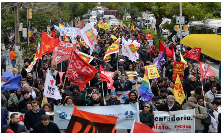
Manifestantes caminham em frente à Justiça do Trabalho.

Organizado pelo Tribunal Regional do Trabalho da 4ª Região (TRT-RS), o Fórum de Relações Institucionais é um espaço coletivo de debate sobre temas pertinentes à Justiça do Trabalho e ao seu funcionamento, permitindo a adoção de ações que levem à melhoria da prestação jurisdicional. Ele reúne mais de dez entidades públicas e privadas ligadas à área trabalhista, incluindo a própria Justiça do Trabalho, o Ministério Público do Trabalho e entidades associativas de