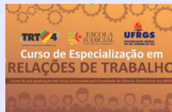
Curso de Especialização em Relações do Trabalho - convênio Ejud4 e UFRGS