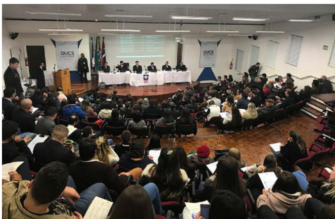
Desembargadores, representante do MPT e secretário na mesa da sessão

A 8ª Turma do Tribunal Regional do Trabalho da 4ª Região (TRT-RS) promoveu uma sessão externa de julgamento no Campus Universitário da Região das Hortênsias da Universidade de Caxias do Sul (UCS), em Canela/RS, na última quinta-feira (6/6). O evento contou com um público de cerca de 300 pessoas, entre estudantes de Direito, profissionais da área e demais interessados.