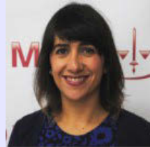
ENTREVISTA: “Convenção coletiva não pode dispor sobre cotas de aprendizagem”, afirma procuradora do Trabalho e coordenadora da Coordinfância