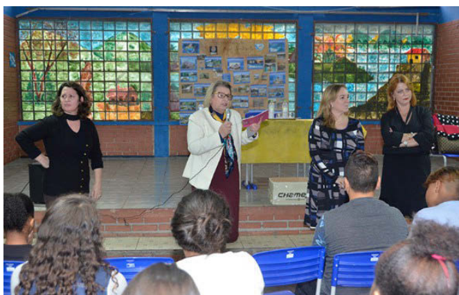
Desembargadoras e a diretora da escola falando para os alunos