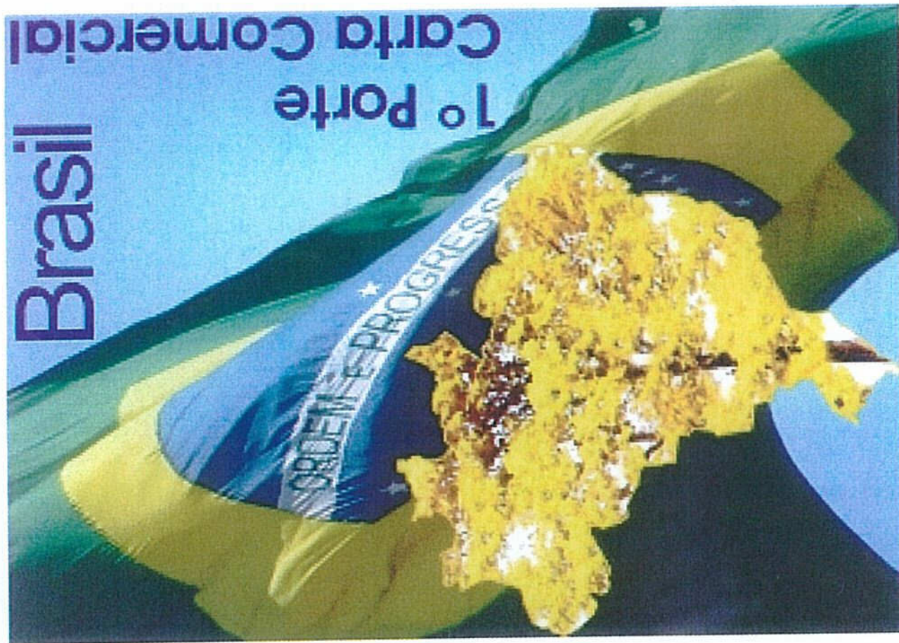
Ipê e Bandeira