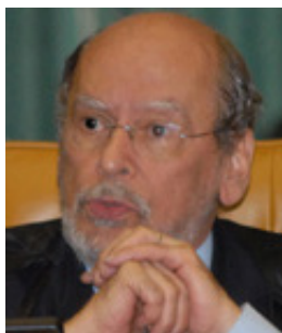
José Paulo Sepúlveda Pertence

CONTRIBUIÇÕES SINDICAIS - INOBSERVÂNCIA DE PRECEITOS CONSTITUCIONAIS A Constituição da República, em seus arts. 5º, XX e 8º, V, assegura o direito de livre associação e sindicalização. E ofensiva a essa modalidade de liberdade cláusula constante de acordo, convenção coletiva ou sentença normativa estabelecendo contribuição em favor de entidade sindical a título de taxa para custeio do sistema confederativo, assistencial,