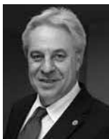
BARROS LEVENHAGEN Presidente