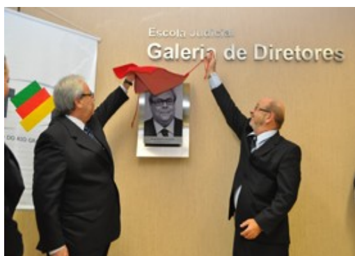
Sirangelo e Denis descerram retrato

Ao final da tarde desta sexta-feira (9/3), foi realizada a solenidade de aposição do retrato do desembargador Flavio Portinho Sirangelo na Galeria de Diretores da Escola Judicial (EJ) do Tribunal Regional do Trabalho do Rio Grande do Sul (TRT-RS). A cerimônia, que marcou também a inauguração da Galeria, ocorreu no lounge da EJ, no Foro Trabalhista de Porto Alegre, e teve a presença da Administração do TRT gaúcho, bem como de diversos magistrados, servidores e familiares do homenageado.