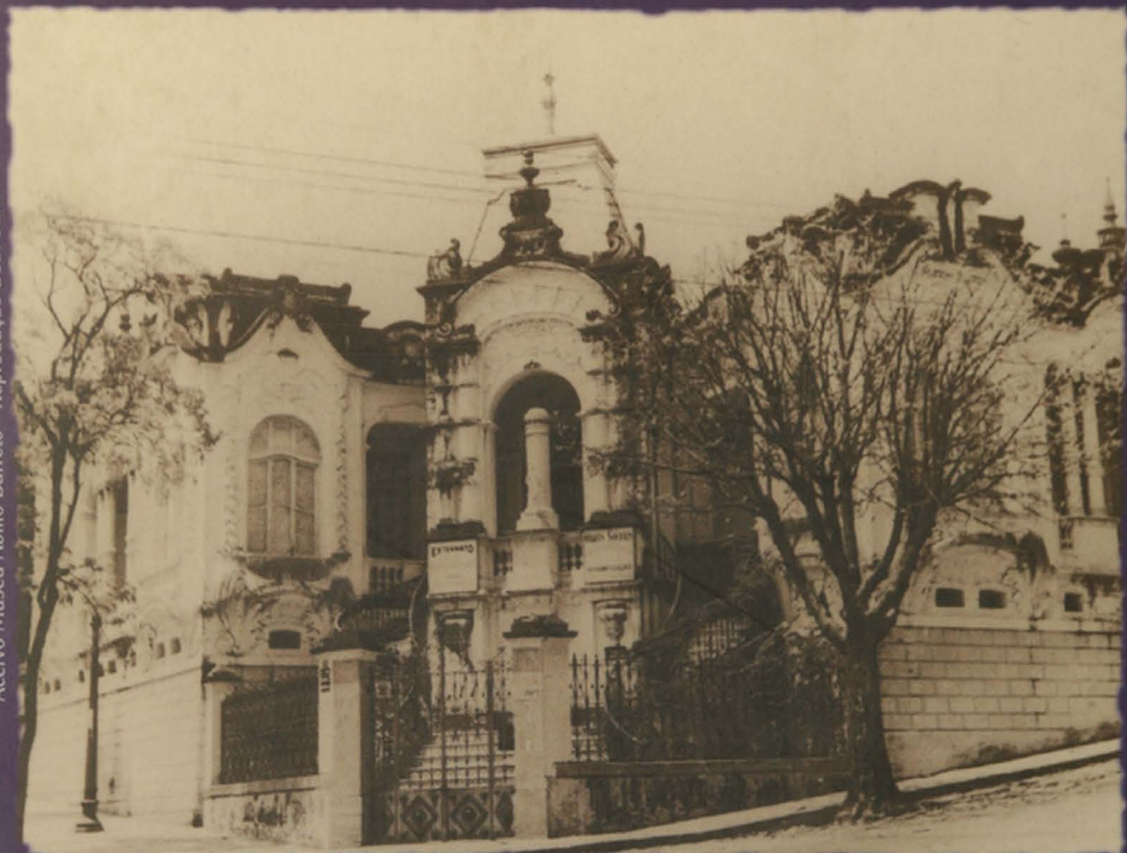
1ª sede da Justiça do Trabalho da 3ª Região - 1941/1943 - Av. João Pinheiro, 276