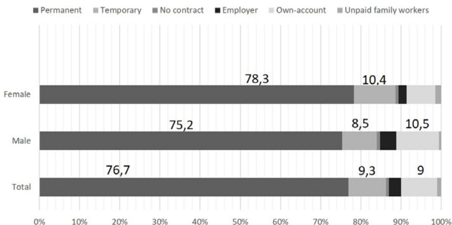
Panel B – High-income countries