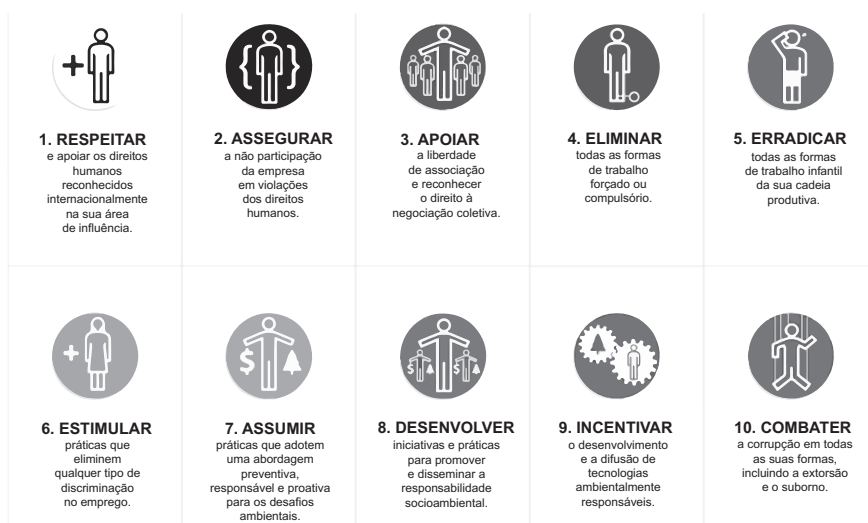
Figura 1. Os 10 Princípios do Pacto Global