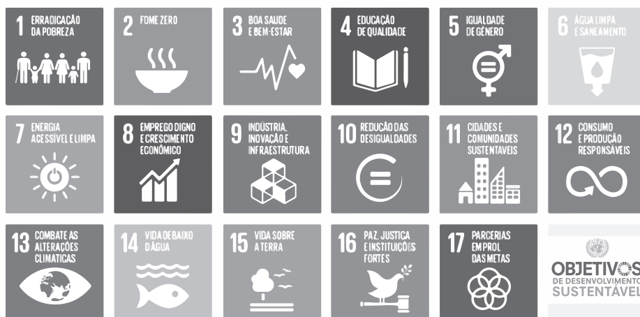
Figura 2. Objetivos de Desenvolvimento Sustentável - ODS

É uma iniciativa voluntária que fornece diretrizes para a promoção do crescimento sustentável e da cidadania, por meio de lideranças corporativas comprometidas e inovadoras, alinhadas com os Objetivos de Desenvolvimento Sustentável - ODS da Agenda 2030, proposta pela ONU e aceita por todos seus países membros.